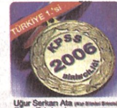
Uğur Serkan Ak